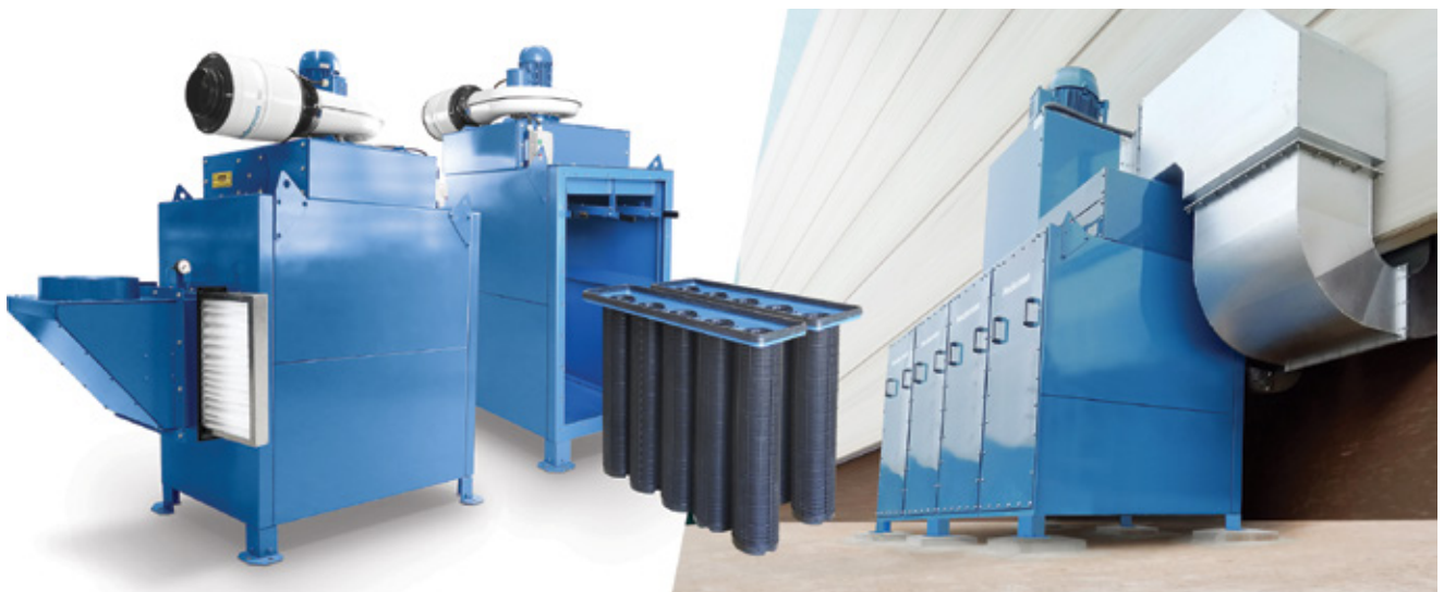
Filtro FMC Carbon modular

O FMC Carbon é um filtro modular de médio porte e equipado com cartuchos filtrantes de carvão ativado facilmente removíveis, o que torna sua manutenção rápida e prática. O FMC Carbon é indicado para vazões a partir de 1.500 m 3 /h, alcançando virtualmente qualquer vazão superior pela disposição conjugada dos módulos filtrantes.