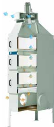
Die Abbildung zeigt den Ablaufprozess in unserem FibreDrain™ Filter.

Nederman Ölnebel Lösungen sammeln Ölnebel und Ölrauch direkt am Entstehungsort in der metallverarbeitenden Maschine. Die ölhaltige Luft wird mit niedriger Geschwindigkeit durch die Schichten der Filtermedien geleitet. Der Luftstrom tritt im unteren Bereich der Filtereinheit ein und verläuft nach oben durch die Filter. Die entsprechende Filteranordnung erzeugt die zunehmende Filterleistung und Effektivität. Das bedeutet je kleiner die Teilchen, desto weiter werden diese in der Luftströmungsrichtung mitgeführt und beanspruchen die Filter. Der so aufgenommene Ölnebel bzw. Ölrauch fließt so durch die Schwerkraft wieder aus der Filterfläche heraus und sammelt sich im Auffangbehälter des Kollektors.