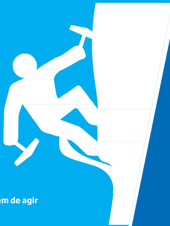
Coragem de agir