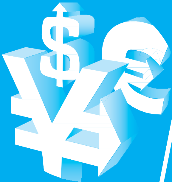
Foco lucrativo no cliente