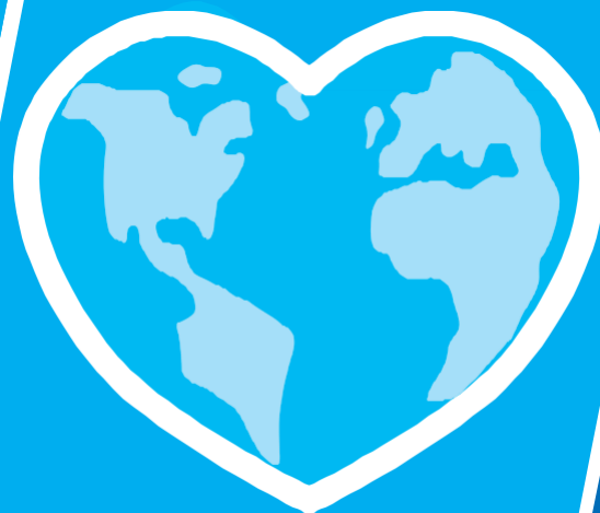
Respeito mútuo e ao meio ambiente