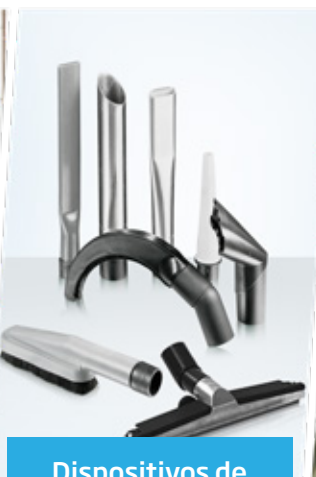
Dispositivos de limpeza