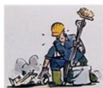
Uso de baldes, estopas, rodos etc.