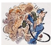
Uso de ar comprimido