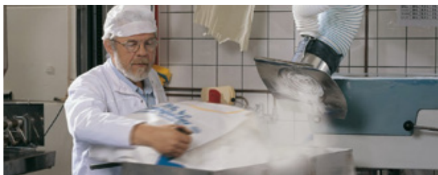
Sistemas de exaustão e filtragem | Sistema de alta vazão