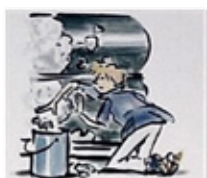
Contato com o particulado