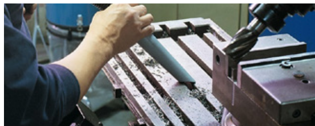
Sistemas centralizados de limpeza | Sistema de alto vácuo