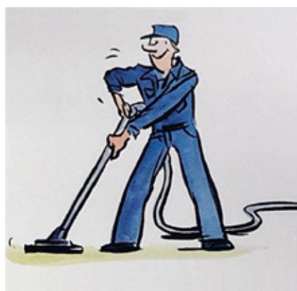
Pontos de limpeza com dispositivos conectados à central de alto vácuo Nederman, favorecendo a ergonomia e saúde dos colaboradores.