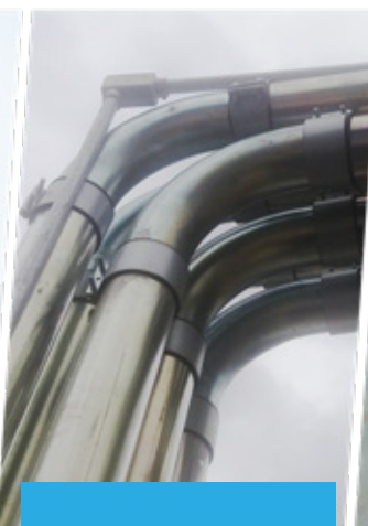
Tubulação de vácuo