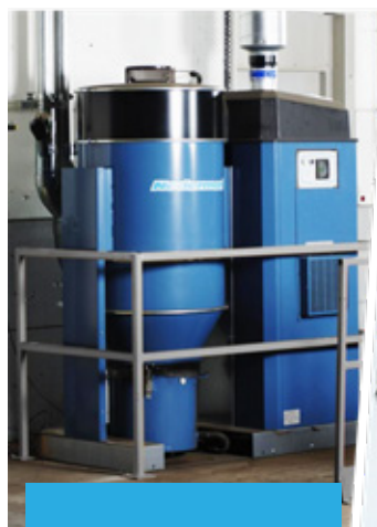
Unidade de vácuo