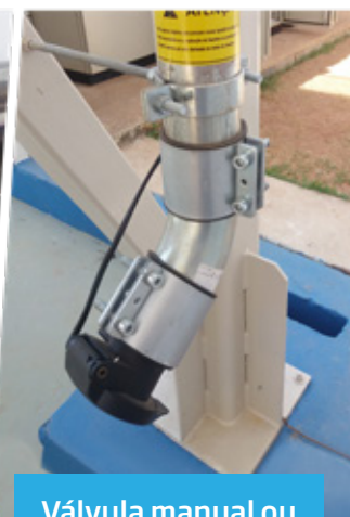
Válvula manual ou automática