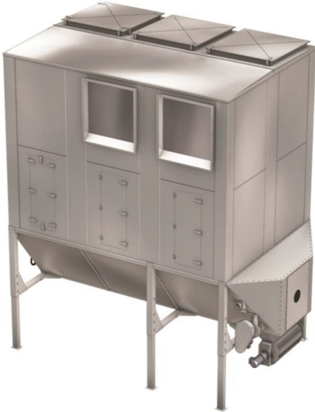
Example: NFKZ3000 2+1 HJ filter with side and top venting for St2 dust

Doekenfilter stofafscheider geschikt voor het verwerken van grote hoeveelheden lucht met besmettingsniveaus van zwaar materiaal