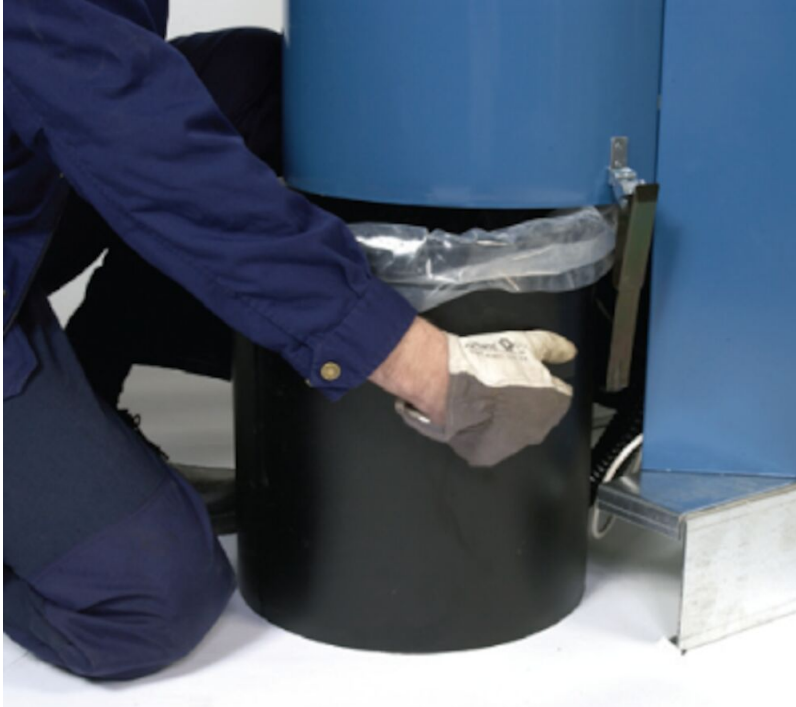
The plastic bin liner is easy to change