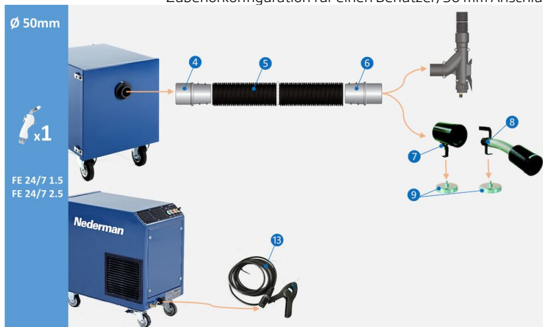
Zubehörkonfiguration für einen Benutzer, 50 mm Anschluss:

Zubehörkonfiguration für einen Benutzer, 50 mm Anschluss an Schweißmaschine. (4) Schlauchkupplung M50-50P, Art.-Nr. 55999416 (5) Schlauch PE-51 L=5 m, Art.-Nr. 55999412 (6) Schlauchkupplung F50-50P, Art.-Nr. 55999417 (7) Runddüse CWN-S 105/50 mit Schalldämpfer, Art.-Nr. 55999415 (8) Runddüse CWN-S 105/50L mit Schalldämpfer, Art.-Nr. 55999414 (9) Magnetfuß für Düse CWN-S, Art.-Nr. 55999419 (13) Sensorklemme mit Stecker für automatische Start-/Stoppfunktion, Art.-Nr. 55999410