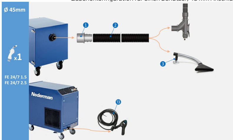
Zubehörkonfiguration für einen Benutzer, 45 mm Anschluss:

Zubehörkonfiguration für einen Benutzer, 45 mm Anschluss an Schweißmaschine. (1) Schlauchkupplung M50-44P, Art.-Nr. 55999418 (2) Schlauch Superflex Ø 45 mm schwarz 5 m, Art.-Nr. 55999411 (3) Absaugflansch TM-200, Art.-Nr. 55999413 (13) Sensorklemme mit Stecker für automatische Start-/Stoppfunktion, Art.-Nr. 55999410