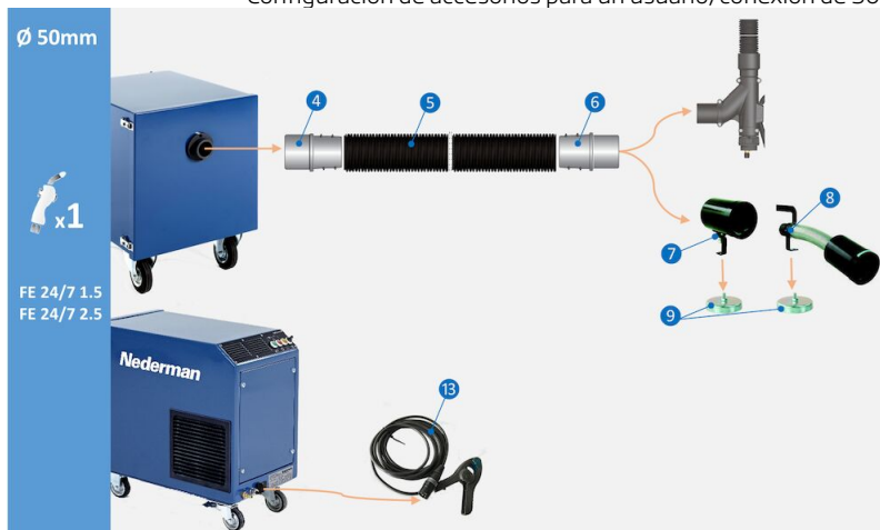
Configuración de accesorios para un usuario, conexión de 50 mm:

Configuración de accesorios para un usuario, conexión de 50 mm (4) Acoplamiento de manguera M50-50P, ref. n.º 55999416 (5) Manguera PE-51 L=5 m, ref. n.º 55999412 (6) Acoplamiento de manguera F50-50P, ref. n.º 55999417 (7) Boquerel con silenciador CWN-S 105/50, ref. n.º 55999415 (8) Silenciador CWN-S 105/50L, ref. n.º 55999414 (9) Base magnética para boquerel CWN-S, ref. n.º 55999419 (13) Pinza sensor para arranque/paro automático, ref. n.º 55999410