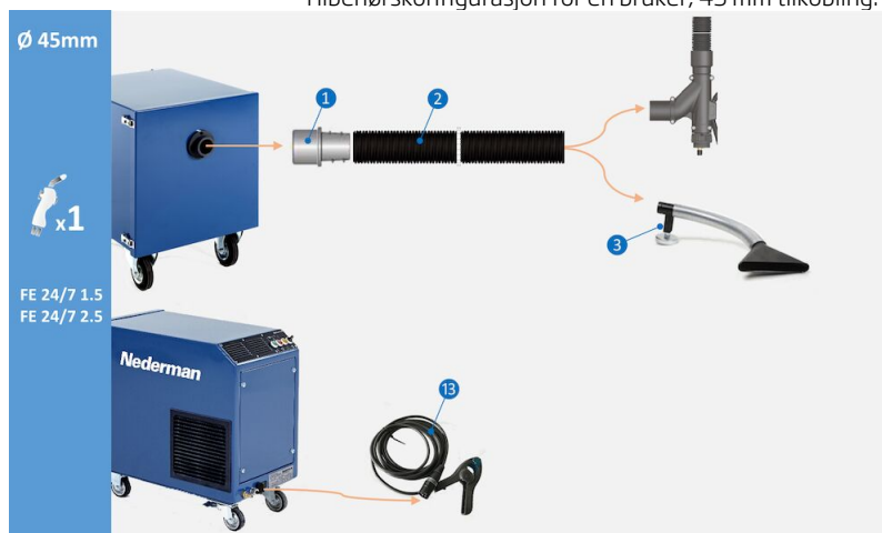
Tilbehørskonfigurasjon for én bruker, 45 mm tilkobling:

Tilbehørskonfigurasjon for én bruker, 45 mm sveiseapparattilkobling. (1) Slangekobling M50-44P, art.nr. 55999418 (2) Slange Superflex Ø 45 mm svart 5 m, art.nr. 55999411 (3) Munnstykke TM-200 trakt, art.nr. 55999413 (13) Sensorklemme med plugg for automatisk start/stopp, art.nr. 55999410