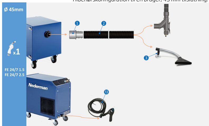
Tilbehørskonfiguration til en bruger, 45 mm tilslutning:

Tilbehørskonfiguration til en bruger, 45 mm tilslutning til svejseapparat. (1) Slangetilslutning M50-44P, art.nr. 55999418 (2) Slange Superflex Ø 45 mm, sort 5m, art.nr. 55999411 (3) Mundstykke TM-200, tragt, art.nr. 55999413 (13) Sensortang med stik til automatisk start/stop, art.nr. 55999410