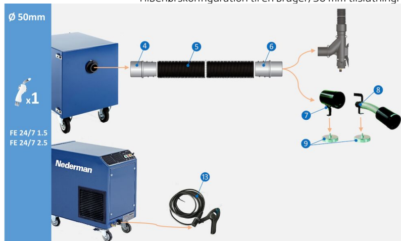
Tilbehørskonfiguration til en bruger, 50 mm tilslutning:

Tilbehørskonfiguration til en bruger, 50 mm tilslutning til svejseapparat. (4) Slangetilslutning M50-50P, art.nr. 55999416 (5) Slange PE-51 L=5 m, art.nr. 55999412 (6) Slangetilslutning F50-50P, art.nr. 55999417 (7) Dyse CWN-S 105/50 Lyddæmper, art.nr. 55999415 (8) Mundstykke CWN-S 105/50L, lyddæmper, art.nr. 55999414 (9) Magnetisk fod til mundstykke CWN-S, art.nr. 55999419 (13) Sensortang med stik til automatisk start/stop, art.nr. 55999410