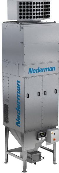
MCP-12S-APT, High version

MCP-12S-APT Hava Temizleme Kulesi (APT), kaynak dumanı veya asılı toz bulunan fabrikalarda ortam temiz havası için yenilikçi bir çözümdür. Atölyenin boyutuna ve düzenine bağlı olarak bağımsız bir ünite olarak veya bir ünite ağı içinde kullanılabilir. Kaynak yakalamanın pratik olmadığı veya kapsamlı hava temizliği için yetersiz olduğu durumlar için idealdir.