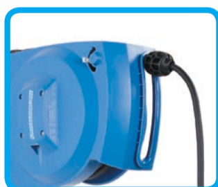
Kabelové navijáky pro elektrické nářadí