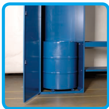
Sud s mazivem