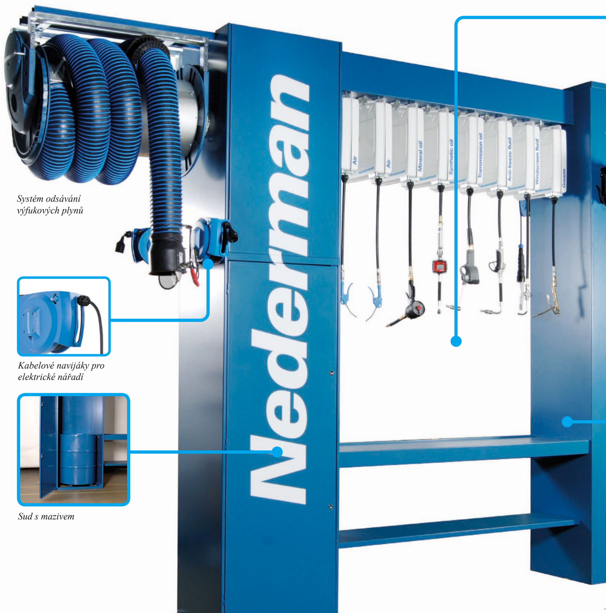
Systém odsávání výfukových plynů

nyní nemusí chodit do hlavního skladu pokaždé, když potřebuje olej nebo jiné kapaliny. Práci lze provádět mnohem bezpečněji, protože na podlaze se nevyskytuje změť kabelů a hadic, které jsou často navíc poškozeny přejetím vozidla. V dílně budete mít také čisté a zdravé prostředí, protože výfukové zplodiny jsou odváděny přímo z výfuků. Systém Nederman ServiceGate také zahrnuje zařízení pro vysávání, které umožňuje udržovat vozidla a pracoviště v bezprašném stavu a čistotě.