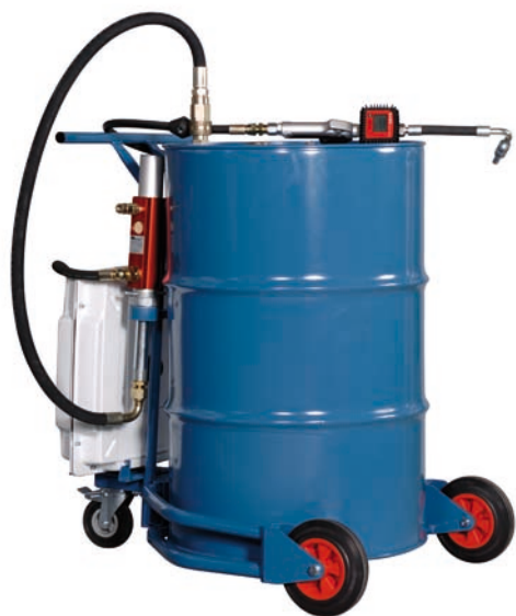
Mobilní servisní vozík s olejem (volitelně). Pohodlná jednotka pro dodávku oleje pro vozidla, která nemají přístup k bráně ServiceGate