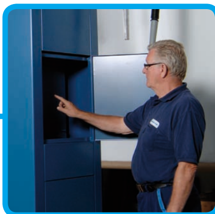
Terminál pro správu olejů