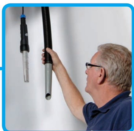
Vysavač pro úklid - pracovní osvětlení