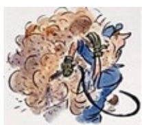
Uso de ar comprimido