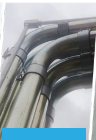
Tubulação de vácuo