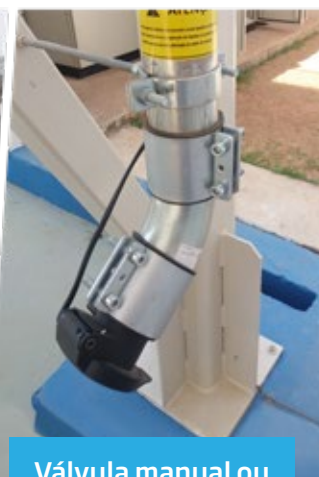
Válvula manual ou automática