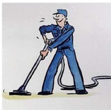
Pontos de limpeza com dispositivos conectados à central de alto vácuo Nederman, favorecendo a ergonomia e saúde dos colaboradores.