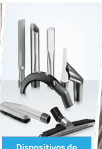
Dispositivos de limpeza