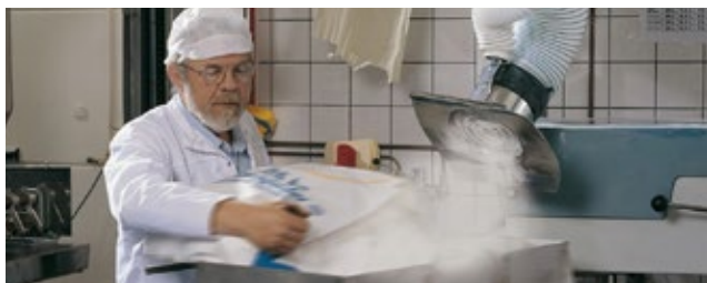
Sistemas de exaustão e filtragem | Sistema de alta vazão