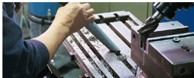
Sistemas centralizados de limpeza | Sistema de alto vácuo