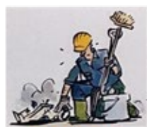
Uso de baldes, estopas, rodos etc.