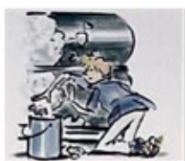
Contato com o particulado